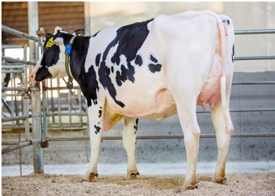
AOT DELUXE HI-LIGHTED DAM