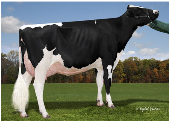
COOKIECUTTER DTA HABITAN FOURTH DAM