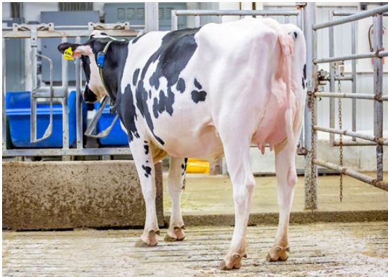
AOT DELUXE HI-LIGHTED DAM